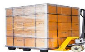
se empaletiza y se envuelve en plástico

empaque es el envoltorio que está en contacto directo con el producto y protegiéndolo, mientras que el embalaje agrupa varios empaques o productos ya empaquetados para su transporte y protección general.