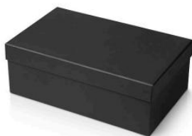
Empaque secundario caja de zapatos