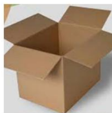
Empaque terciario caja master