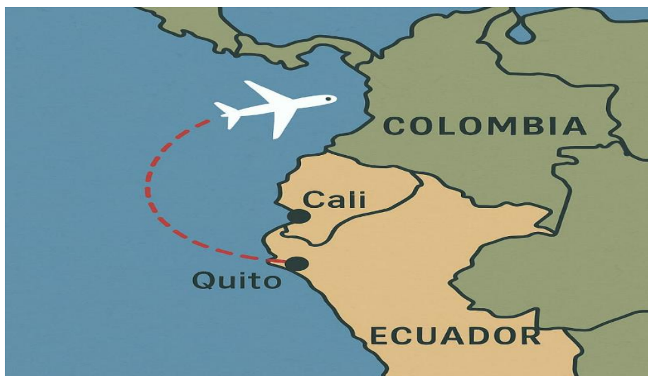
Ilustración 2. acceso aereo