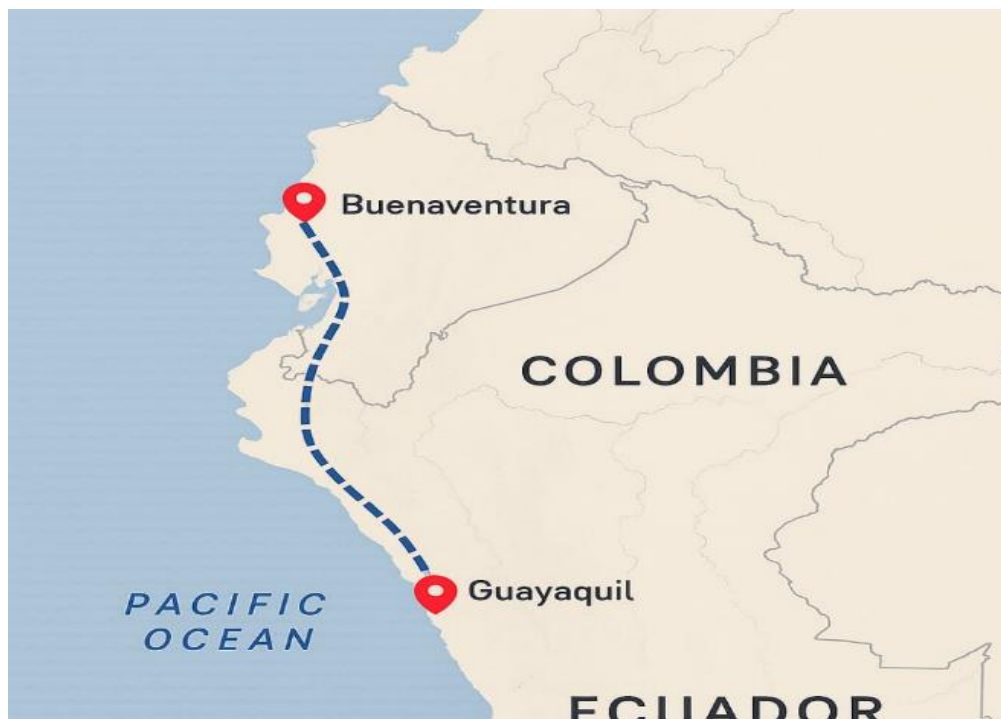
Ilustración 1. mapa marítimo