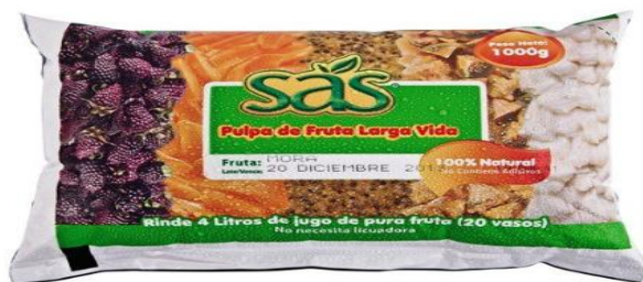
Imagen 9 Pulpa de Fruta.

Polietileno de baja densidad: se empacan 4 bolsas de 250g dentro de una bolsa más grande de polietileno.