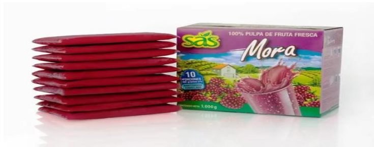
Imagen 10 Caja de Pulpa de Fruta