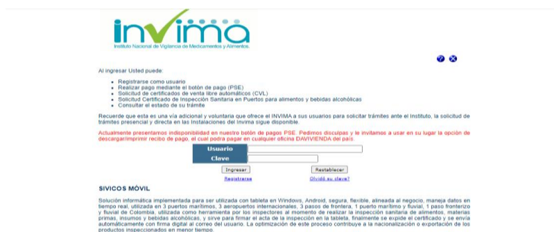
Imagen 3 Sitio Web invima

Registrarse en Línea y Verificar el Valor a Pagar por el Certificado